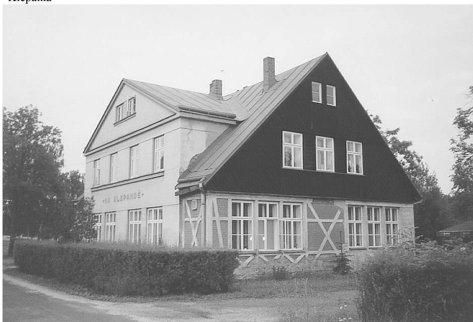
A takto vypadá hospoda dnes (foto léto 2000)